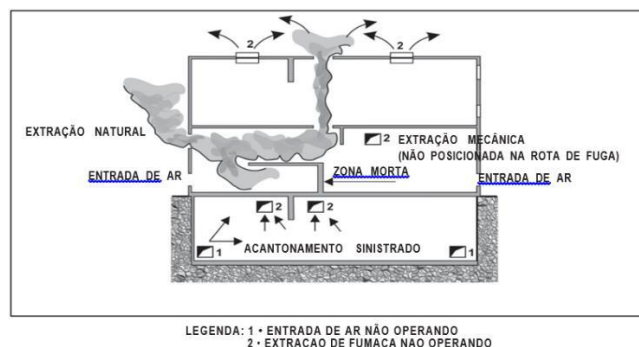
Figura 2: Zonas mortas

3.1.3 O controle de fumaça é obtido pela introdução de ar limpo e pela extração de fumaça, pelos seguintes tipos de sistemas, conforme Tabela 1.