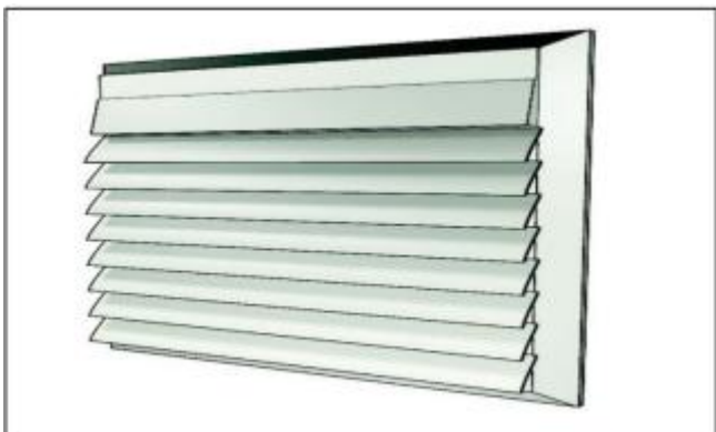
Figura 4: Grelha de fumaça

7.2.2.2 As grelhas e venezianas devem ser de materiais incombustíveis utilizados na condução de ar, podendo conter dispositivos corta-fogo (ex.: registros corta-fogo e fumaça) quando necessário.